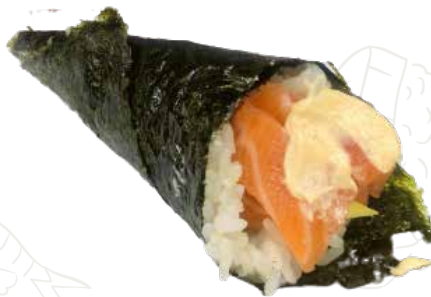
49 SPICY SAKE TEMAKI 4,50 €

alghe nori, salmone, cetriolo, salsa piccante