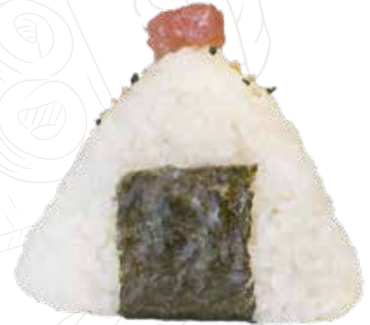
122 ONIGIRI SPICY TUNA 4,50 € tonno, tabasco, philadelphia