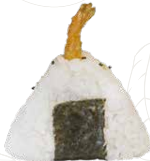
124 ONIGIRI EBI 4,00 € gambero cotto