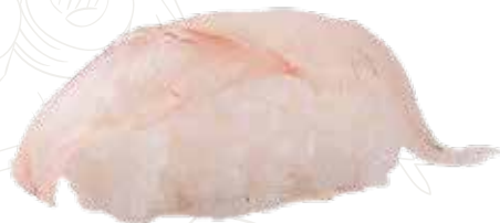
26 SUZUKI 3,00 € branzino