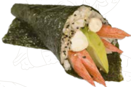
48 CALIFORNIA TEMAKI 4,00 €