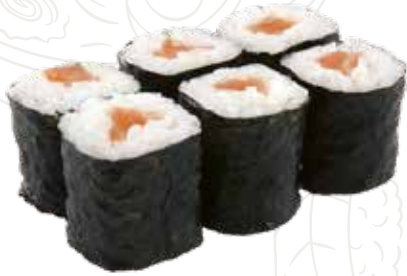
54 HOSSO SAKE 4,00 € salmone

ROTOLO DI RISO RIPIENO DI UN SOLO INGREDIENTE