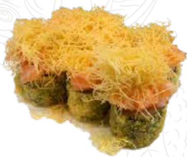
63 HOSSO FRITTO SAKE 6,00 €

ROTOLO DI RISO RIPIENO DI UN SOLO INGREDIENTE