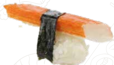
30 KANI 3,00 € granchio