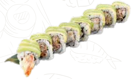
97 DRAGON ROLL 12,00 €

12,00 € salmone fritto, maionese, ricoperto di pesce bianco con uova di salmone (1-2-4)