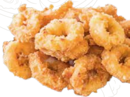
19 ANELLINI DI CALAMARO 6,00 €