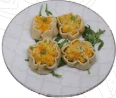
10 MAY GYOZA 4,50 €

shao mai, misto gamberi, pesce e carne al vapore (4 pz) (1-2-3-4)