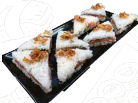
110 TRAMEZZINO SAKE 10,00 €

salmone, uova di pesce, cipolla, philadelphia, tabasco