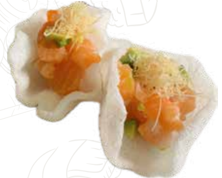
21 KIKKO TACOS 5,00 €

nuvolette di drago con tartar di salmone, avocado, kadaifi, salsa teriyaki (1-4-6)