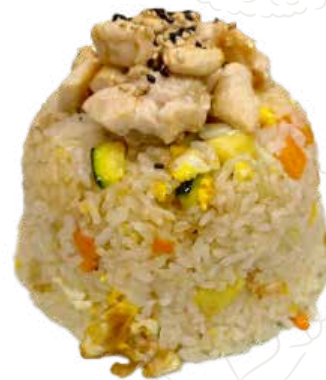
130 TORI MESHİ 6,00 €

riso alla piastra con pollo, verdure, uova