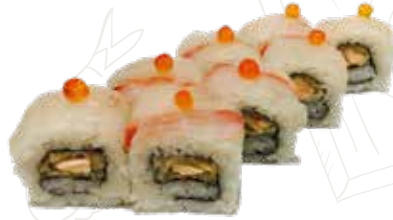
96 TIGER ROLL

granchio, avocado, maionese, ricoperto di pesce misto (1-2-3-4-11)