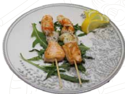
154 SPIEDINI FRUTTI DI MARE (4PZ) 8,00 €