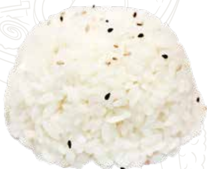
125 RISO BIANCO 3,50 €