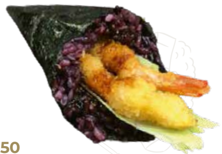
50 VENUS TEMAKI 5,00 €

alghe nori, riso nero, tempura gamberone, insalata, maio, teriyaki