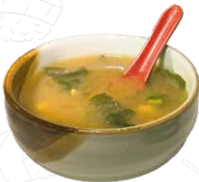
22 ZUPPA MISO 4,00 €

zuppa di miso con tofu, alghe, cipolline