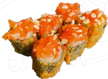
64 HOSSO FRITTO SAKE HOT 6,00 €

misto pesce, salmone tartar, teriyaki, kadaifi (1-3-4-6)