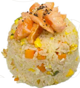
129 SAKE MESHİ 6,00 €

riso alla piastra con salmone, verdure, uova