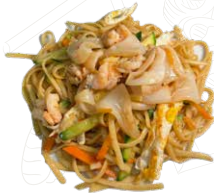
144 LINGUINE MARE 6,00 €

spaghetti linguine con frutti di mare, verdure, uova