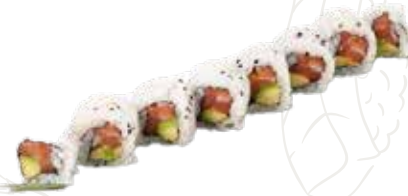
90 SAKE URA 9,00 €