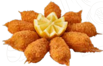
20 CHELE DI GRANCHIO 5,00 €