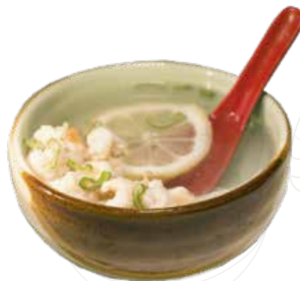
23 ZUPPA MARE 5,00 €

zuppa con gamberi, surimi, seppie, cipolline