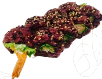
99 VENUS ROLL

12,00 € (1-2-4-6-7-8) riso venere, tempura gamberone, philadelphia, ricoperto di salmone mandorle, salsa teriyaki