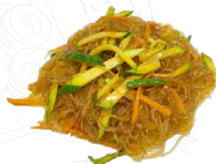
136 SPAGHETTI SOIA VERDURE 5,00 €

spaghetti giapponesi con manzo, verdure, uova (1-3-6)