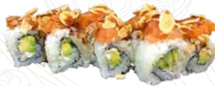
111 ROCK'N ROLL 10,00 €

philadelphia, avocado, tartar sake, mandorle, teriyaki