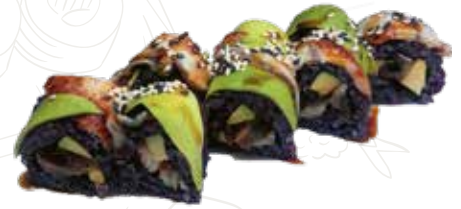
106 ANAGO ROLL

13,00 € riso nero, tempura gambero, guarnito con anguilla e avocado, salsa teriyaki