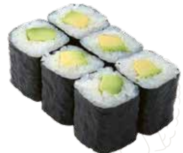
59 HOSSO AVOCADO 4,00 € avocado