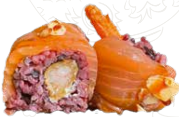
98 BLACK DRAGON ROLL

tempura gamberone, insalata, ricoperto di avocado (1-2-3-6-11)