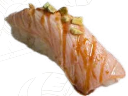
35 SAKE FLAME PISTACCHIO 4,00 €

salmone scottato, pistacchio, salsa teriyaki