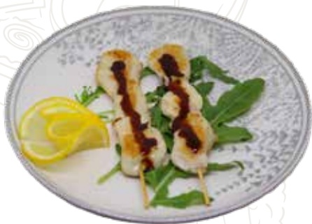
153 YAKI TORI 6,00 €