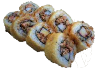
118 SAKE MAKI FRITTO

salmone, tobiko, philadelphia, granchio, avocado con frittura di uova e farina (1-2-3-4-6-7)