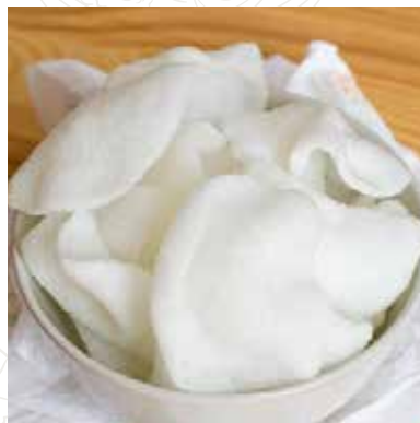
14 NUVOLETTE DI DRAGO 3,50 €