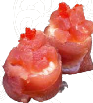
44 GUNKAN MAGURU 5,50 € tonno, tartar di tonno, tobiko