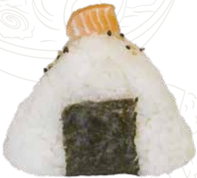
120 ONIGIRI SAKE 4,00 € salmone