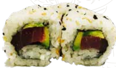
89 TONNO URA 10,00 €