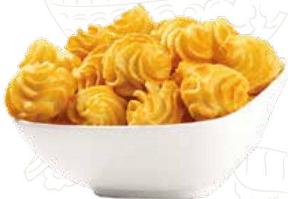
13 PATATINE DUCHESSE 4,50 € (6 pz)