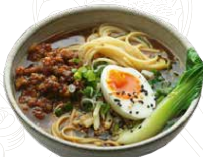
141 GYUNIKU RAMEN 6,50 €

ramen con verdure e uova in brodo (1-3-6)