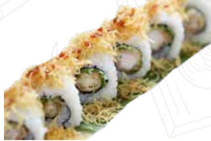
87 EBITEN URA 10,00 €

tempura di gamberone, insalata, maionese (1-2-3-6-11)