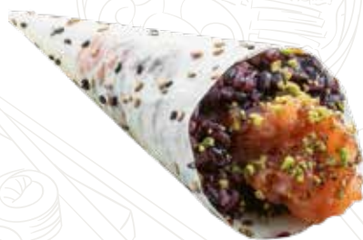
52 SOY SALMON VENUS 5,00 €

foglio di soia, riso venere, salmone, pistacc., teriyaki