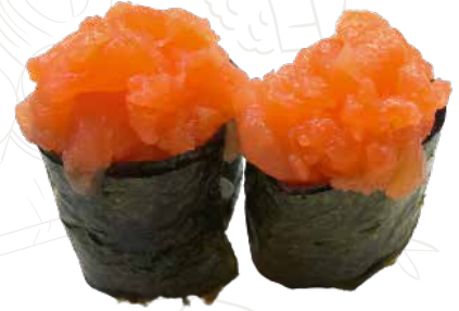
39 GUN SALMON 4,00 € alghe nori, tartar di salmone