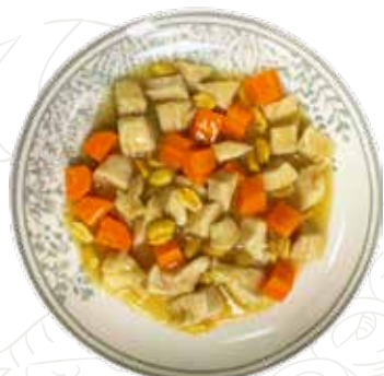
159 POLLO ALL'ANACARDI 6,00 €