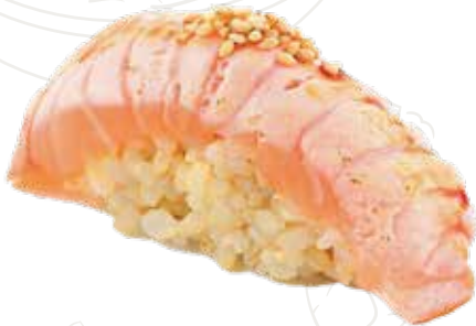
33 SAKE FLAME 4,00 €