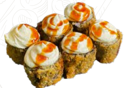
62 HOSSO FRITTO PHILADELPHIA 6,00 € misto pesce, philadelphia, teriyaki