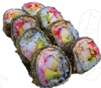
117 MAKI FRITTO