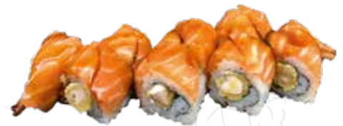
109 EBITEN PLUS ROLL 12,00 €

tampura gamberone, philadelphia, ricoperto di salmone, teriyaki