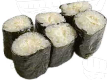
57 HOSSO PHILADELPHIA 3,50 € philadelphia