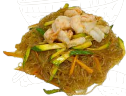
137 SPAGHETTI SOIA MARE 6,00 €

spaghetti soia, frutti di mare, verdure (1-2-4-6-14)