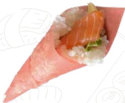
51 SOY SALMON TEMAKI 5,00 €

foglio di soia con salmone, insalata, teriyaki