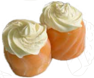
41 GUNKAN PHILADELPHIA 5,00 € gunkan philadelphia