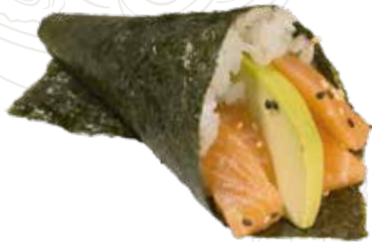
45 SAKE TEMAKI 4,50 €