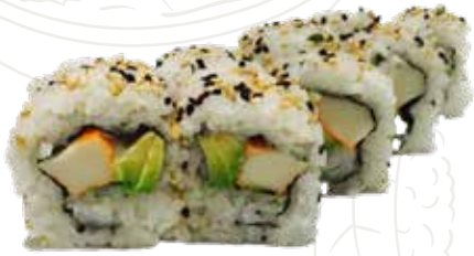
86 CALIFORNIA URA 8,00 €