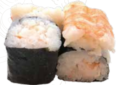
56 HOSSO EBI 4,00 € gambero cotto