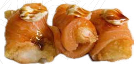
53 SAKE FLOWER (3 PZ) 5,50 €

gambero fritto, philadelphia, salmone, teriyaki