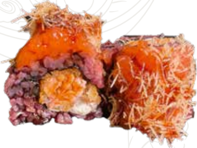
113 VENUS SAKE SPECIAL ROLL