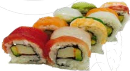
95 RAINBOW ROLL 12,00 €

granchio, avocado, maionese, ricoperto di pesce misto (1-2-3-4-11)