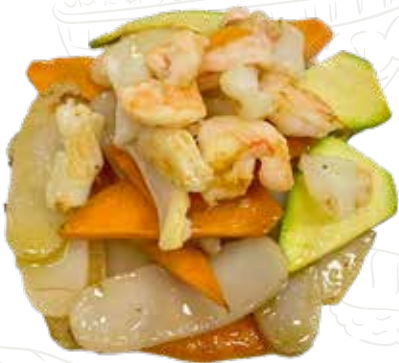
146 GNOCCHI MARE 6,00 €

gnocchi di riso saltati con frutti di mare, verdure