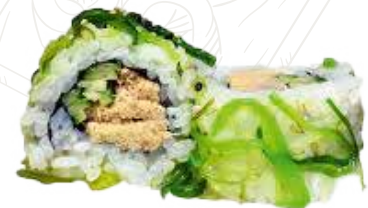
103 WAKAME ROLL 10,00 €

granchio, avocado, cetriolo, maionese, cipolla fritta (1-2-3-6)