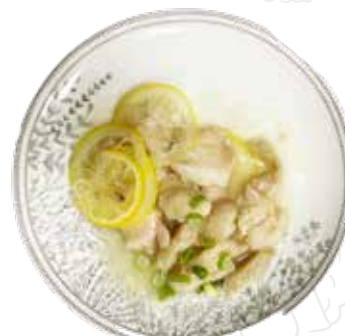
158 POLLO AL LIMONE 6,00 €