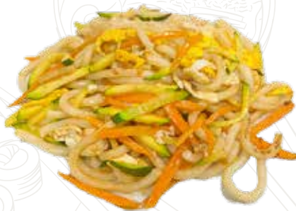
132 YASAI UDON 5,00 €