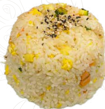
127 YASAI MESHİ 5,00 €