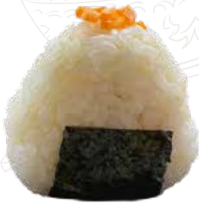
123 ONIGIRI VEGETARIANO 3,00 € verdure