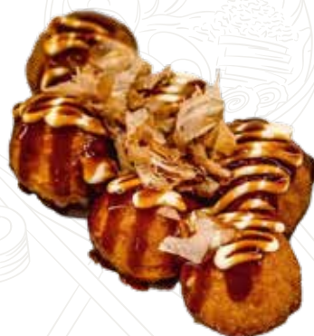
17 TAKOYAKI 5,50 € polpetta di pollo (4 pz)