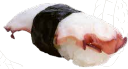
28 TAKO 3,00 € polipo con salsa teriyaki