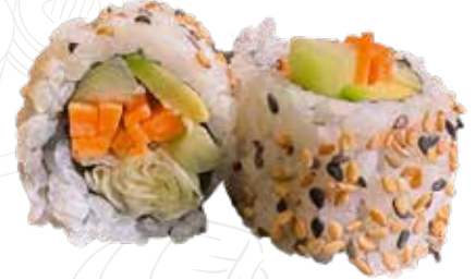
115 VEGETARIANO URA