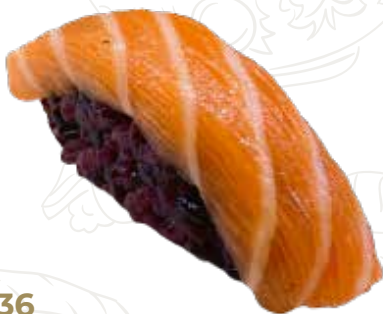
36 SAKE VENUS 3,50 €