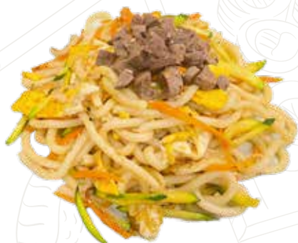
135 GYUNIKU UDON 6,00 €

spaghetti giapponesi con pollo, verdure, uova (1-3-6)