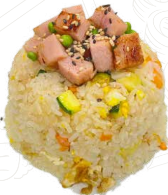
126 RISO CANTONESE 6,00 €

riso alla piastra con prosciutto, uova, piselli, verdure