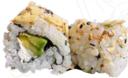
114 VEGAN ROLL

riso nero, salmone fritto, kadaifi, philadelphia, tartardi salmone, salsa teriyaki (1-4-6-7)