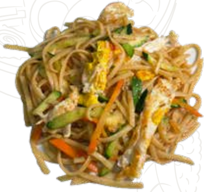
143 LINGUINE VERDURE 5,00 €