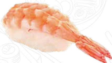
31 EBI 3,00 € gamberi cotti