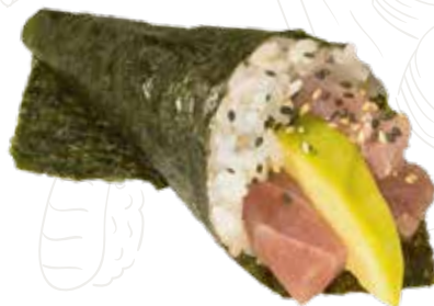
46 MAGURU TEMAKI 5,00 €