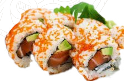
94 TOBIKO ROLL 10,00 €