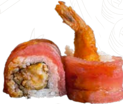
105 MAGU EBI ROLL

13,00 € tempura gamberone, maionese, guarnito con tonno e salsa teriyaki