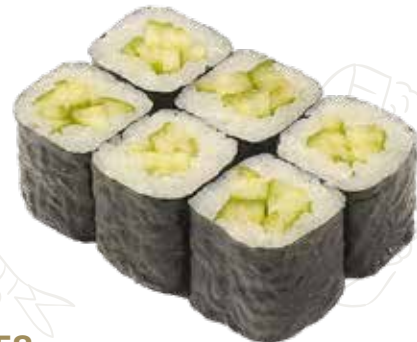
58 HOSSO KAPPA 3,50 € cetriolo