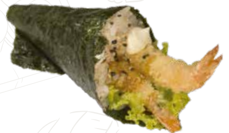
47 EBITEN TEMAKI 5,00 €

alghe nori, tempura gamberone, insalata, maio, teriyaki