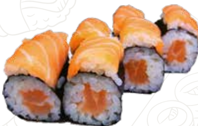
60 COPPA SAKE 5,00 € salmone