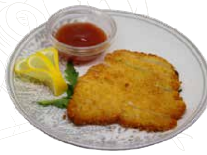
155 TORI KATSU 6,00 €