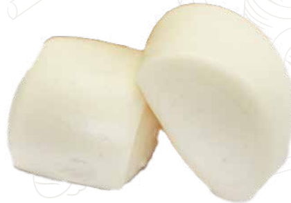
11 PANE AL VAPORE 3,50 €

shao mai, misto gamberi, pesce e carne al vapore (4 pz) (1-2-3-4)