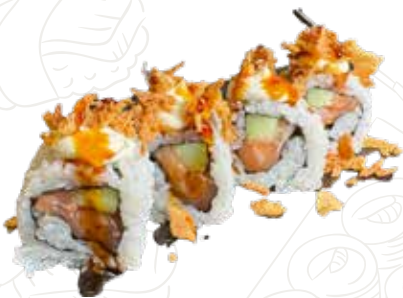
101 ONION SAKE ROLL 12,00 €

salmone, cetriolo, philadelphia, cipolla fritta, teriyaki (1-4-6-7)