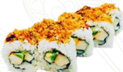
102 ONION ROLL 10,00 €

salmone, cetriolo, philadelphia, cipolla fritta, teriyaki (1-4-6-7)