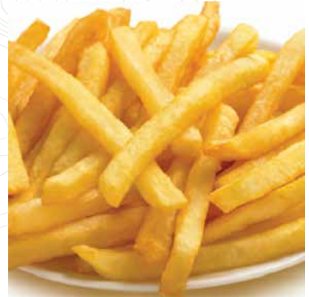
12 PATATINE FRITTE 3,50 €