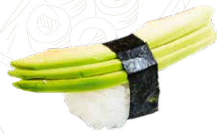
32 AVOCADO 3,00 € avocado