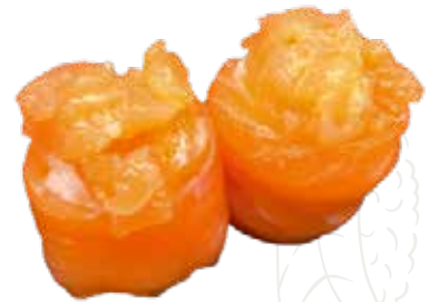
42 GUNKAN TARTAR 5,00 € salmone, tartar di salmone