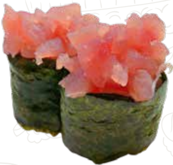
40 GUN TUNA 4,50 € alghe nori, tartar di tonno