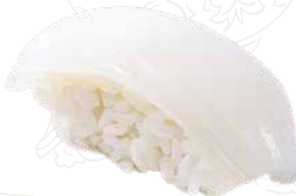
27 IKA 3,00 € calamaro