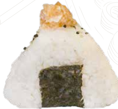
121 ONIGIRI MIURA 4,00 € salmone, philadelphia