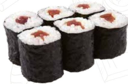
55 HOSSO MAGURU 4,50 € tonno