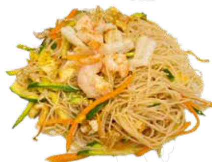
139 SPAGHETTI RISO MARE 6,00 €

spaghetti di riso con verdure, uova (1-3-6)