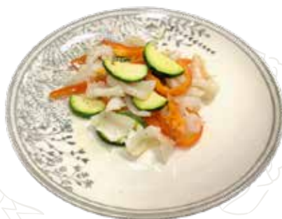
157 CALAMARI SALTATI ALLA PIASTRA 6,00 €