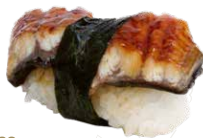
29 UNAGI 4,00 € anguilla con salsa teriyaki