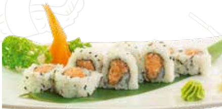
92 SPICY SAKE URA 9,00 €

salmone, tabasco, philadelphia (3-7-11-16)