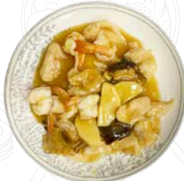
160 GAMBERI FUNGHI E BAMBÙ 6,00 €