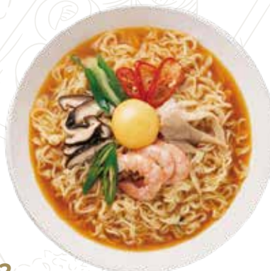
142 YAKI RAMEN 6,50 €

ramen con manzo, verdure e uova in brodo (1-3-6)