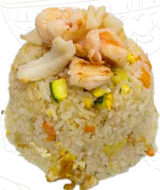
128 YAKI MESHİ 6,00 €

riso alla piastra con frutti di mare, verdure, uova