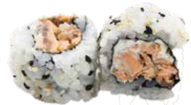
91 KING URA 9,00 €

salmone affumicato, philadelphia (4-7-11)