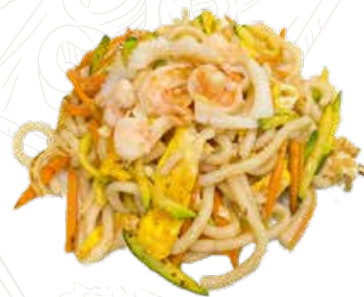
133 YAKI UDON 6,00 €

spaghetti giapponesi con frutti di mare, verdure, uova