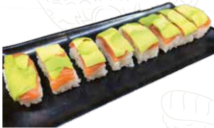
107 DREAM ROLL 10,00 €