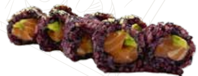
112 VENUS SAKE URA 9,00 €