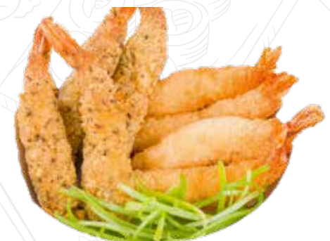
18 GAMBERETTI IMPANATI 6,00 € (5 pz)