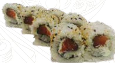
93 PHILADELPHIA URA 9,00 €