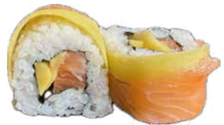
100 MANGO ROLL

10,00 € (1-2-3-6-7-11) riso venere, tempura gamberone, insalata, maionese, teriyaki