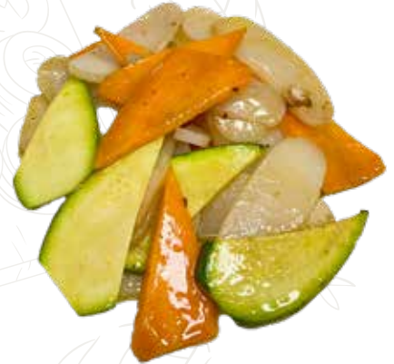
145 GNOCCHI VERDURE 5,00 €