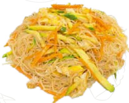
138 SPAGHETTI RISO VERDURE 5,00 €

spaghetti soia, frutti di mare, verdure (1-2-4-6-14)