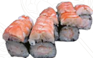
61 COPPA EBI 4,50 € gambero cotto