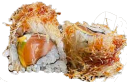
108 SAKE SPECIAL ROLL 10,00 €

salmone, avocado, philadelphia, kadaifi, salsa teriyaki