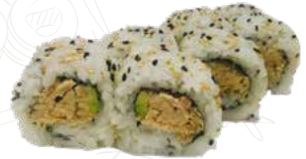
88 TUNA URA 9,00 €

tempura di gamberone, insalata, maionese (1-2-3-6-11)