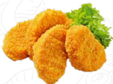
16 NUGGETS POLLO 6,00 € (6 pz)