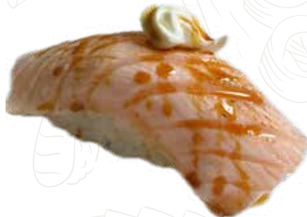
34 SAKE FLAME PHILADELPHIA 4,00 €

salmone scottato, philadelphia, salsa teriyaki