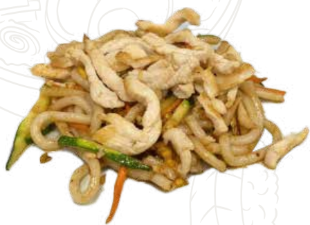
134 TORI UDON 6,00 €

spaghetti giapponesi con pollo, verdure, uova (1-3-6)