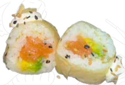
119 SOY SAKE ROLL

salmone affumicato, granchio con frittura di uova e farina (1-2-3-6)