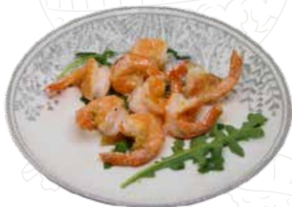
156 GAMBERETTI SALE E PEPE 6,00 €