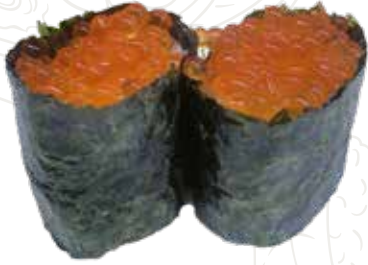
37 GUN TOBIKO 3,00 € uova di pesce (tobiko)