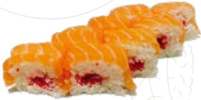
104 KIKKO ROLL 9,00 €

salmone, philadelphia, tobiko senza alghe