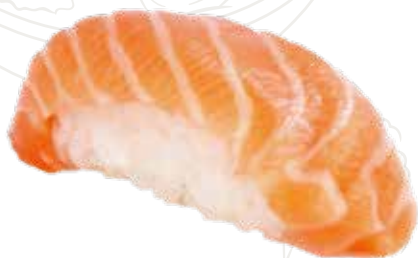
24 SAKE 3,00 € salmone