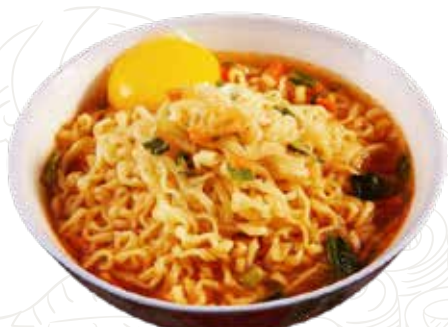
140 YASAI RAMEN 6,00 €

spaghetti di riso con frutti di mare, verdure, uova (1-2-3-6-14)