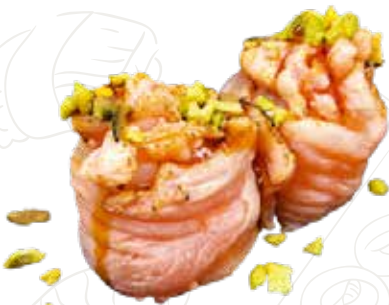
43 GUNKAN SAKE FLAME 5,00 € salmone, tartar di salmone, pistacchio, teriyaki