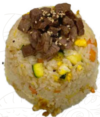
131 GYUNIKU MESHİ 6,00 €

riso alla piastra con manzo, verdure, uova