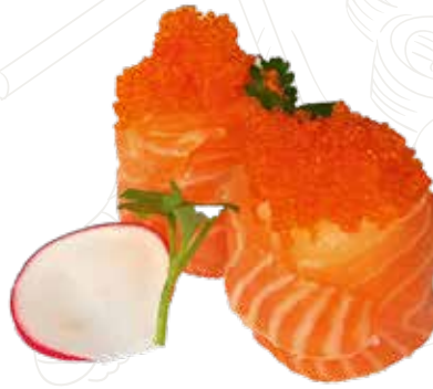
38 GUN SAKE 5,00 € salmone, tobiko