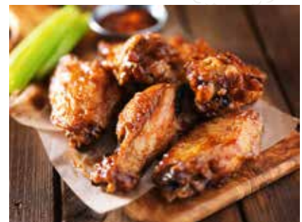
15 ALETTE DI POLLO 5,50 € (4 pz)